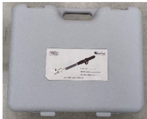
Maletín y arnés